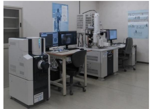
走査型電子顕微鏡*