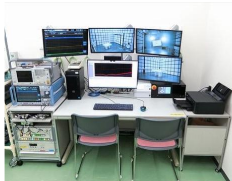
エミッション(EMI)測定システムは(公財)JKAより競輪補助を受けて導入しました。