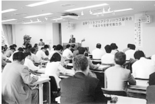
<実験風景および報告会風景写真>