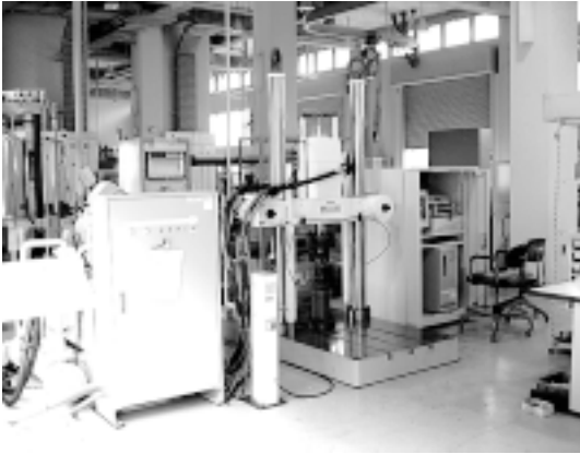
疲労試験機(国庫補助機器)

構造物に繰り返し荷重が加わるような場合、静的な試験での破壊強度よりも低い応力レベルの荷重であっても破壊につながる恐れがあり、静的な試験だけでは構造物の耐久性を推測することができません。このような場合、構造物に実際に繰り返しを加える疲労試験を行い、耐久性を考慮する必要があります。本疲労試験機は、油圧制御により繰り返し荷重を加えることができる装置です。また、引張や圧縮などの静的な試験も行うことができます。