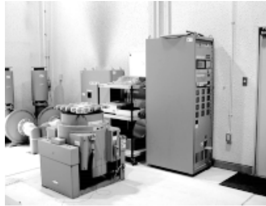
振動試験機(日本自転車振興会補助機器)

この装置は、電気機器・機械装置等の工業製品やその梱包物が、稼働中または輸送中に受けるおそれのある機械的振動に対し、その耐性を評価するための試験装置です。正弦波振動による定周波試験や周波数掃引試験のほか、広帯域の周波数振動を同時に加えるランダム振動試験、衝撃に対する耐性を評価するショック試験なども可能です。