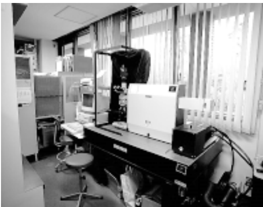
ラマン分光システム(国庫補助機器)

ラマン分光は、赤外分光法と同じ振動分光法の一つで、物質固有の情報が得られます。また、赤外分光法では不可能な物質の情報も得られます。